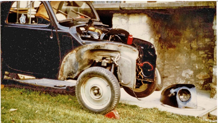
Die Arbeiten am Topi musste ich im Freien durchführen

Endlich eine Arbeitsstelle gefunden, konnte ich nach dem ersten Salär auch die ersten Ersatzteile für meinen Topolino kaufen. Die damalige Firma Jean Götz AG, Ersatzteile für italienische Fahrzeuge, war unsere Ersatzteilquelle.