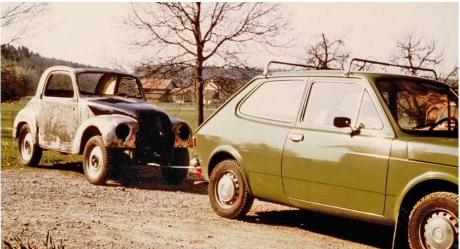
Der abgelaugte Topolino kann zum Lackierer abgeschleppt werden

Natürlich wurde ich umgehend auch Mitglied im Topolino Club Zürich und nahm an dem wöchentlichen Sonntagsstamm um 11.00 Uhr im Restaurant Tobelhof in Zürich teil, um wertvolle Erfahrungen zum Topolino von den erfahrenen Kollegen zu gewinnen. Die Topolino-Fahrer von damals waren verständlicherweise jung und meist unverheiratet. So beschlossen sie jeweils spontan, im Anschluss des Stamms, eine Sonntagsausfahrt zu unternehmen. Ich dagegen fuhr jeweils wieder nach Hause, um die gewonnenen Kenntnisse am Topolino umzusetzen. Die Restauration zur damaligen Zeit und in meinem jungen Alter von 23 Jahren war verständlicherweise nicht in der heutzutage bekannten Perfektion. Auch hatte ich keine beheizte Garage zur Verfügung und erledigte die meisten Arbeiten im Freien. Das führte dazu, dass ich im Winterhalbjahr bei Minustemperaturen, lediglich auf einer Plane unter dem Topi liegend den Boden im Freien vom Unterbodenschutz mittels Kratzen befreite.